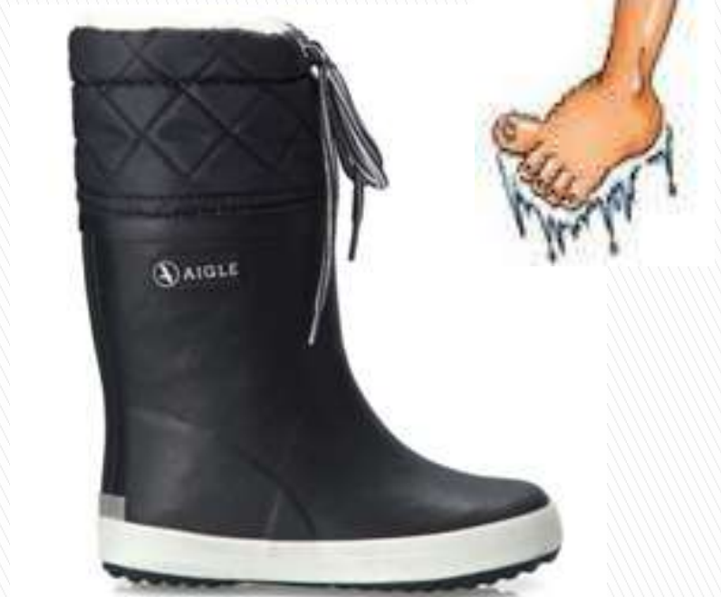
Støvler til brug om vinteren...