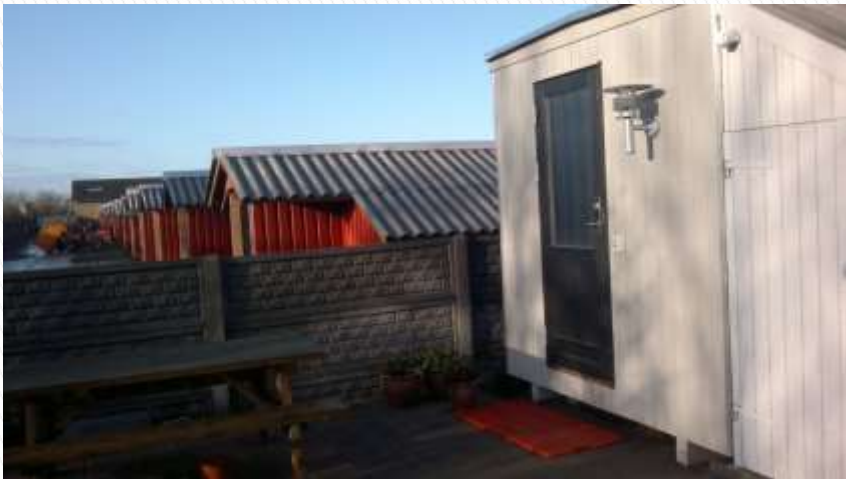
Indgang til farmen