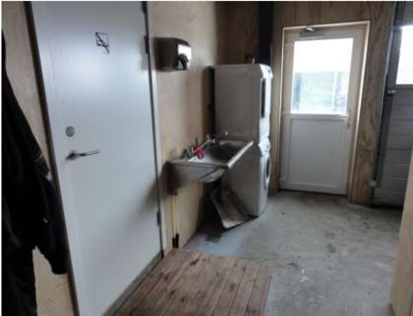
Ren / uren zone