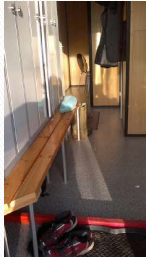
Ren / uren zone