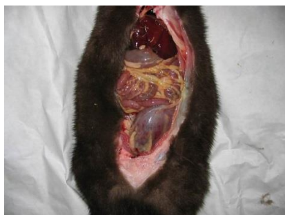
Mink med blærebetændelse

Ramte mange farme sidste år med tab af hvalpe til følge, typisk visende sig forinden frafaldet ved våd bug. En del tilfælde startede allerede midt i juni måned. Denne lidelse kan forebygges ved at tilsætte Ammoniumchlorid til foderet i perioden juni til ultimo august, hvor lidelsen ofte ebber ud. Den korrekte dosering er 3 kg Ammoniumchlorid pr ton foder – men det har vist sig at, 1½-2 kg kan være tilstrækkeligt – doseret daglig i perioden. Ammoniumchlorid findes som 25 % opløsning i palletanke – i så fald skal der bruges mindst 8 liter pr ton foder. Bruges midlet i tør form, er det vigtigt at foderet bliver udfodret med det samme, idet det giver en fæl afsmag, hvis det henstår nogle timer i fodermaskinen. Det er en fordel at opløse pulveret i en del vand, inden det blandes i foderet – men det skal bruges med det samme! Nogle avlere har brugt den store dosis – men så bare 3 gange om ugen – med gode resultater, det er ikke den korrekte dosering, men det har virket i mange farme – i så fald må I forsøge Jer frem.